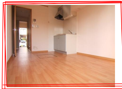
写真は同型モデル☆