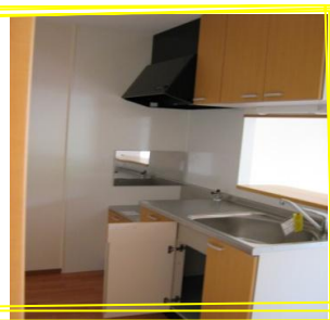
カウンターキッチン