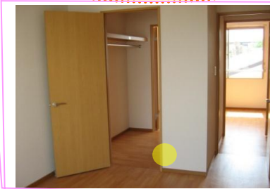
ウォークインクローゼット