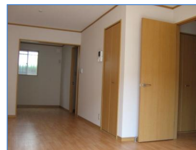
リビング&キッチン