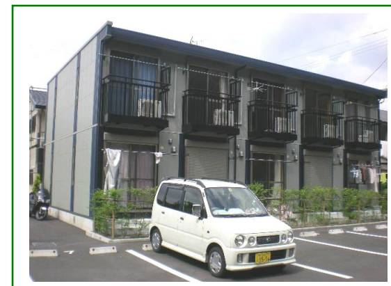
モダンな外観と温かみのある室